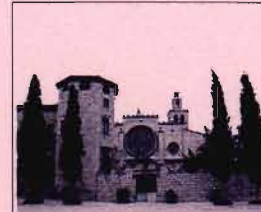
MONESTIR DE SANT CUGAT

Club Excursionista Sant Quirze del Vallès