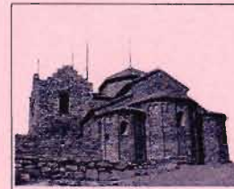
MONESTIR DE SANT LLORENÇ