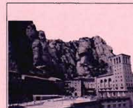
MONESTIR DE MONTSERRAT